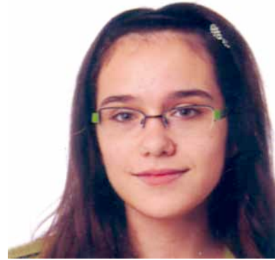
Irati Asategi DBH 4. maila